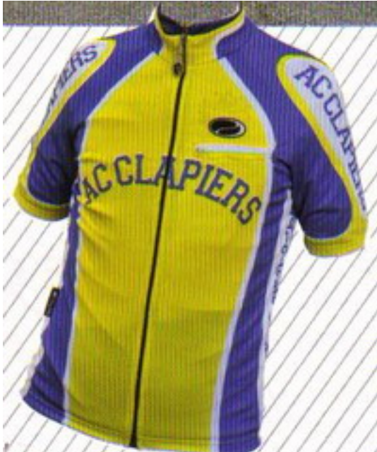
Avec un maille très respirant et un col en tulle, ce maillot est idéal pour les longues sorties en ville ou à la campagne. Il est disponible en taille S, M, L, XL et XXL. Le prix est de 50,00 €.